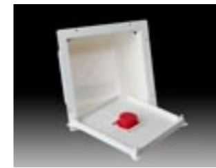
Scanbox m. låg

Bemærk: Der er ikke behov for at anvende Scan-Box ved montering af Scan-Products SL-spots.